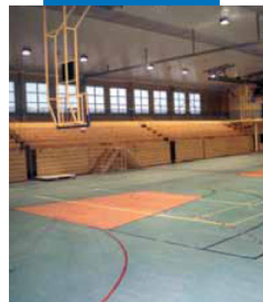
Пример использования Primer G перед укладкой ПВХ и линолеума в спортивном зале - Спортивный зал Гданск Оруна - Польша

с нормами классификации смесей. Рекомендован к применению с обычными мерами предосторожности при работе химическими продуктами. Паспорт безопасности доступен по запросу.